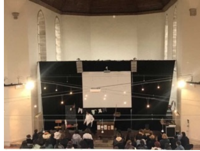
Tout Dépend du Nombre de Vaches, Coutances avril 2022