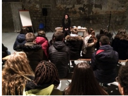
Tout Dépend du Nombre de Vaches, résidence décembre 2019, Atelier 231