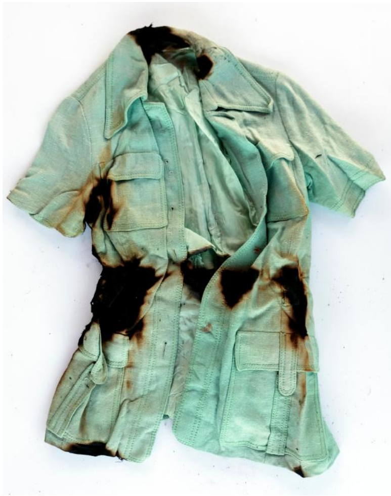
Vêtement Brûlé in situ, Uzeste, Avril 2017.