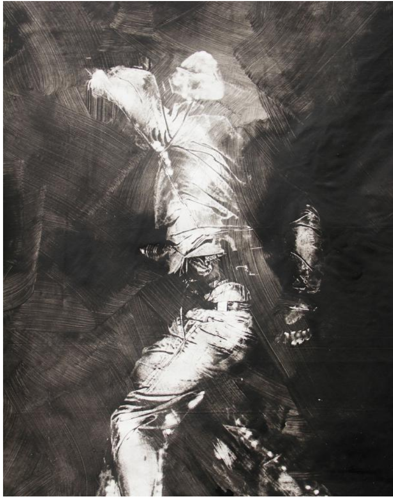
Toile Empreinte, Atelier 231, Sotteville-les-Rouen, Avril 2008.

"L'Installation d'une Catastrophe" est dédiée à la mémoire des génocides du 20 e siècle.