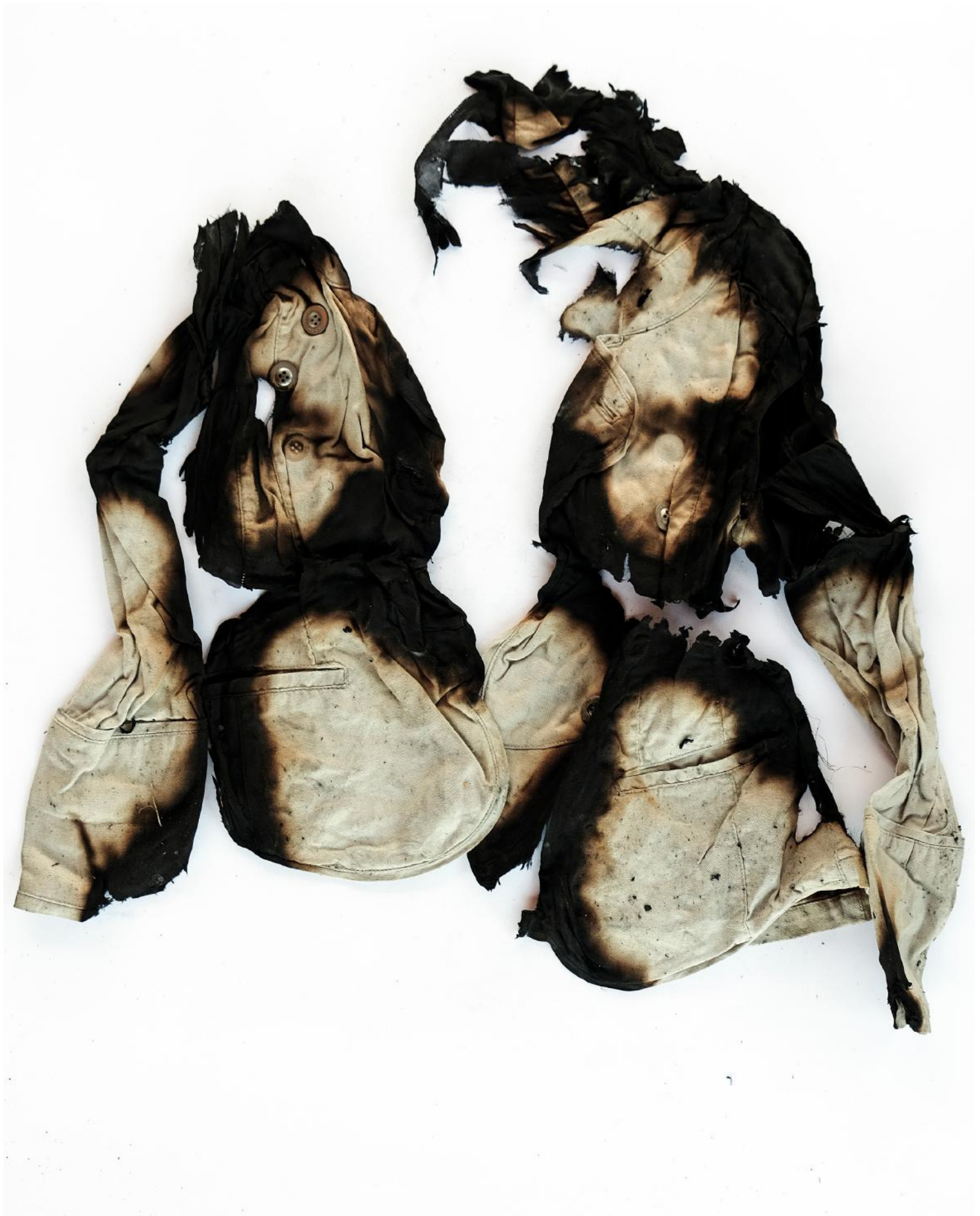
Vêtement Brûlé in situ, Uzeste, Avril 2017.

Installation d'une catastrophe Compagnie uz&coutumes