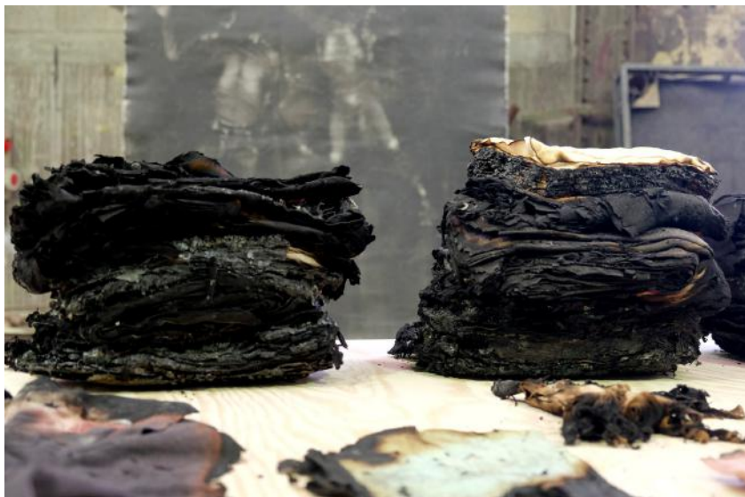
Installation d'une catastrophe, Atelier 231, Sotteville-les-Rouen, Novembre 2017.

"On ne meurt pas d'horreur. C'est là un chagrin indicible. Il faut le dire.