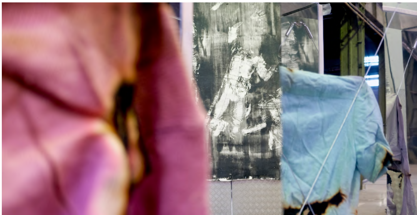
Installation d'une catastrophe, Atelier 231, Sotteville-les-Rouen, Novembre 2017.

Elle fait partie d'un dispositif plus vaste constitué d'une pièce de théâtre, de l'édition d'un recueil de textes inédits (essentiellement des témoignages), s'inscrivant dans un parcours ininterrompu de recherches, d'investigations et d'aller retour - relations entre la France et le Rwanda.